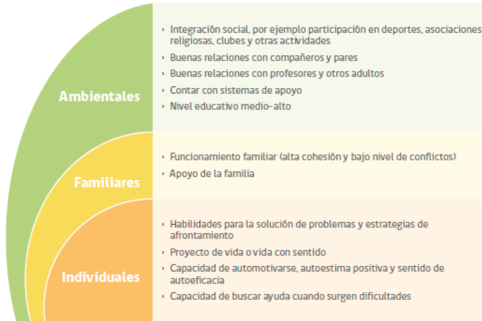
FIGURA 2. FACTORES PROTECTORES CONDUCTA SUICIDA EN LA ETAPA ESCOLAR