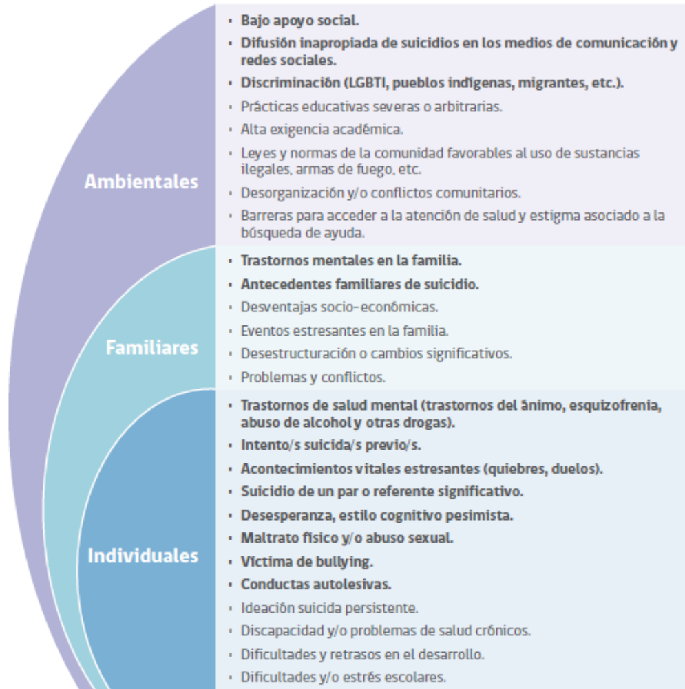
FIGURA 1. FACTORES DE RIESGO CONDUCTA SUICIDA EN LA ETAPA ESCOLAR